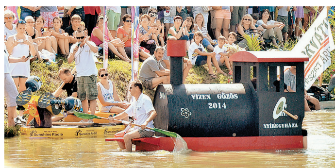
A közeljövő egyik sóstói attrakciója az úszó alkalmatlanságok tréfás vetélkedője lesz