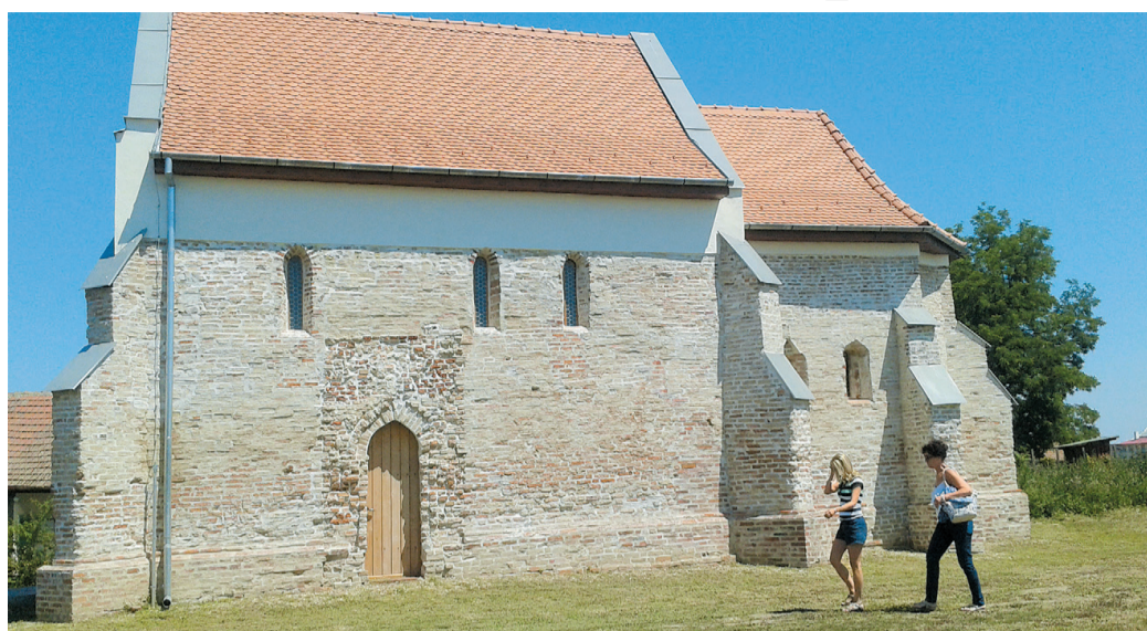
A gyülekezet nélküli csomaközi templom látogatható

- Amikor tizenegy esztendője idekerültem, szomorú kép tárult elém. Mindenütt por, szemet, egyszerűen háborzongató volt a látvány. A szegénység miatt nem tudtuk mit kezdeni; hogy legalább az állapot ne romoljon, ha-