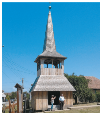
A csomaközi harangtorony