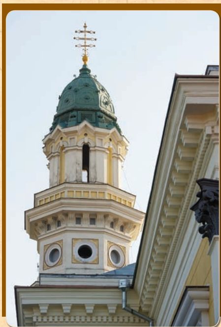
* A broszura Terdik Szilveszter, Mihajlo Prijmics leírása alapján készült

Die griechisch-katholische Gemeinde konnte die Kirche im Jahr 1991 wieder in Besitz nehmen. Im Jahr 2001 wurde die Reliquien des selig gesprochenen Bischofs Tódor Romzsa im Heiligkreuzaltar untergebracht. Die Ikonen und die Mosaiken der über dem Haupteingang befindlichen Deësis-Reihe sind die Arbeiten des griechisch-katholischen Pfarrers und Künstlers László Puskás.