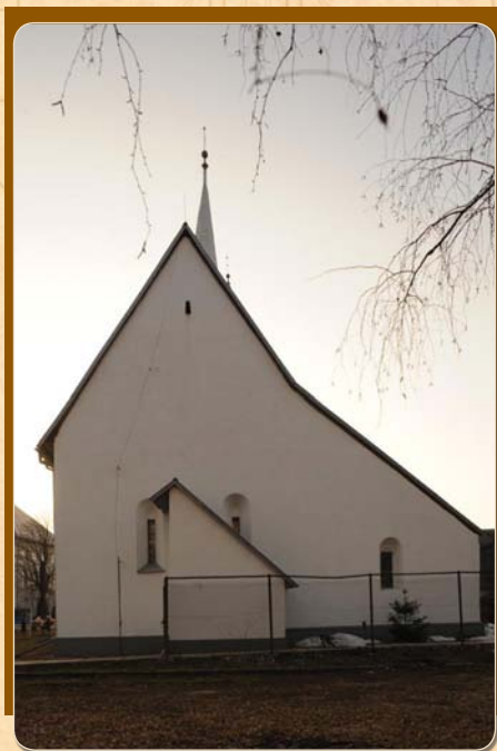
* A brossura Szakács Béla Zsolt leírása alapján készült