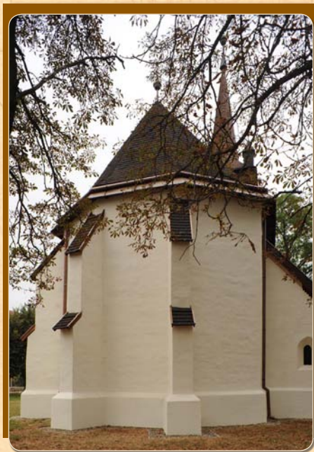
* A broszura Juan Cabello leírása alapján készült

Die erste Restaurierung der Kirche im 20. Jahrhundert geschah im Jahr 1974. Im Jahr 2007 wurden die Instandsetzungsarbeiten der Kirche fortgesetzt, dabei erfolgte die teilweise Erneuerung des Kirchturms und die Restaurierung des Zifferblatts der Uhr. Weitere archäologische Forschungen und Restaurierungen wurden in den Jahren 2010 bis 2011 durchgeführt. Im Ergebnis dessen werden nicht nur die gefundenen Kunstwerke der Kirche vorgestellt, sondern auch die restaurierte Sakristei und die sechs Turmgeschosse zeigen auf einzigartige Weise eine Ausstellung, durch die die Besucher die Kleinstadt und ihre historische Vergangenheit kennen lernen können.